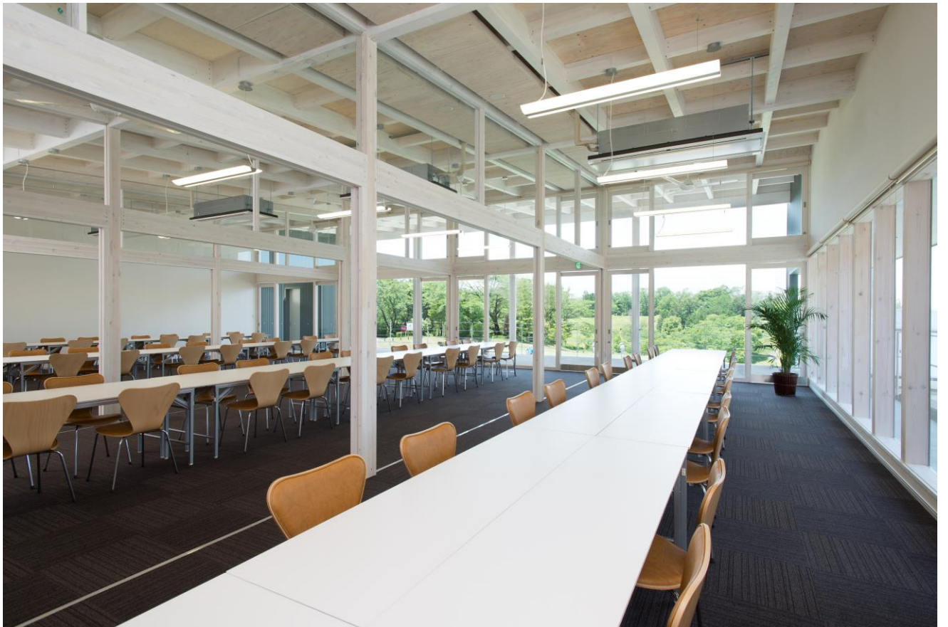
用途：集会場 規模：347㎡(延床) 平屋建て