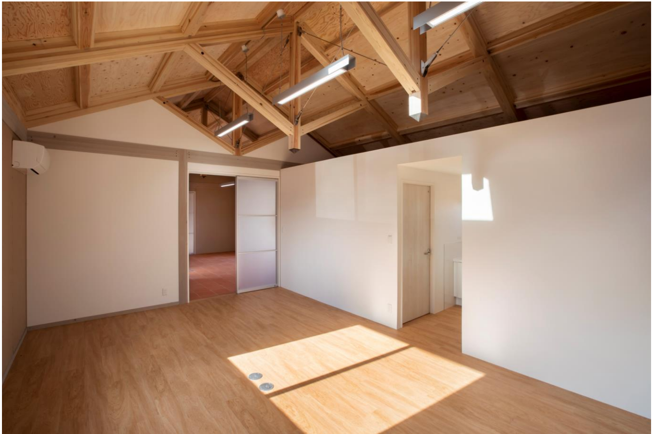
用途：事務所 規模：108㎡(延床) 平屋建て