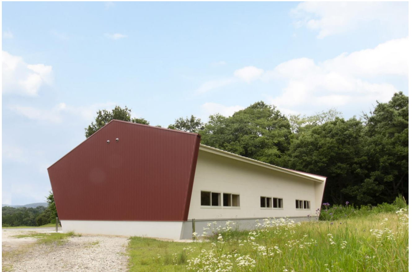
用途：倉庫 規模：147㎡(延床) 平屋建て