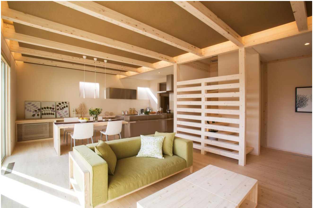
用途：店舗/展示住宅 規模：240/129㎡(延床) 2階建て