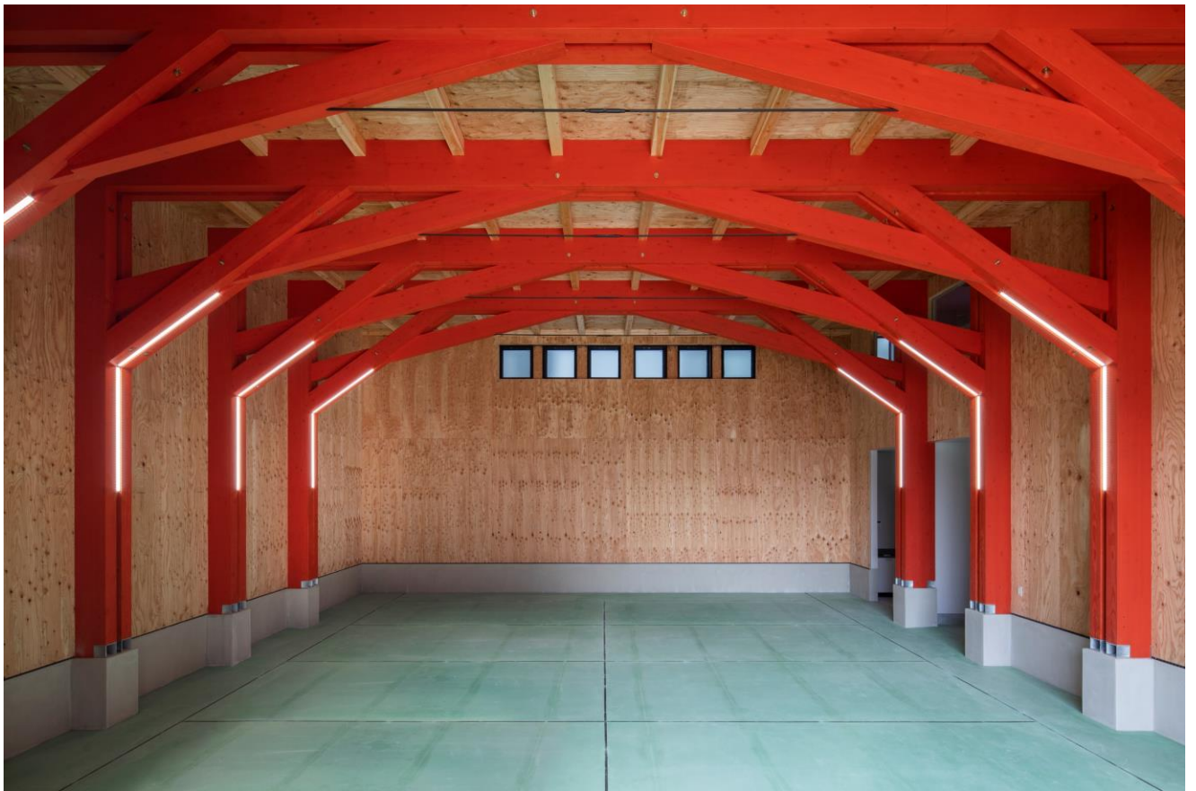
用途：事務所/倉庫 規模：425㎡(延床) 2階建て