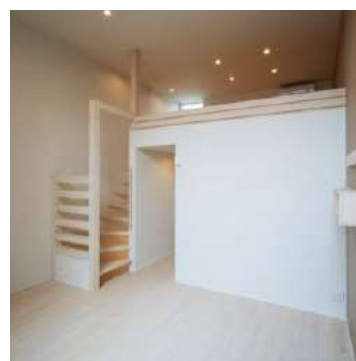
コレクション浅間町 North 室内2