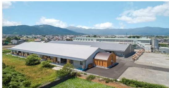
フォレストノート岐阜工場