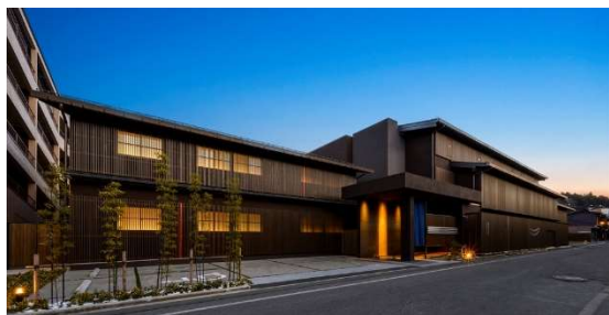
当社が開発運営しているHOTEL WOOD 高山